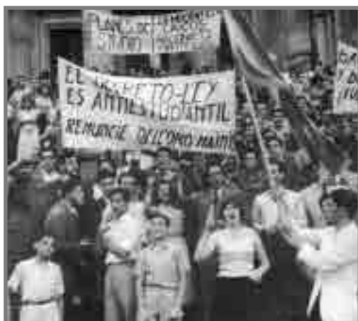
Movilización laica o libre (1958/59)

La evaluación de instituciones, carreras y desempeños académicos individuales fue introducida en la universidad argentina en la década del 90, como un componente de la reforma neoliberal. Los dispositivos resultantes expresaron el saldo de una negociación con los intereses de diversos actores, así como una relativa adaptación a sus prácticas, lo que permitió que la evaluación se incorporara, no sin contradicciones pero aparentemente de manera irreversible, a la cultura académica, y generara cambios significativos cuyos alcances aún deben ser, ellos mismos, evaluados.