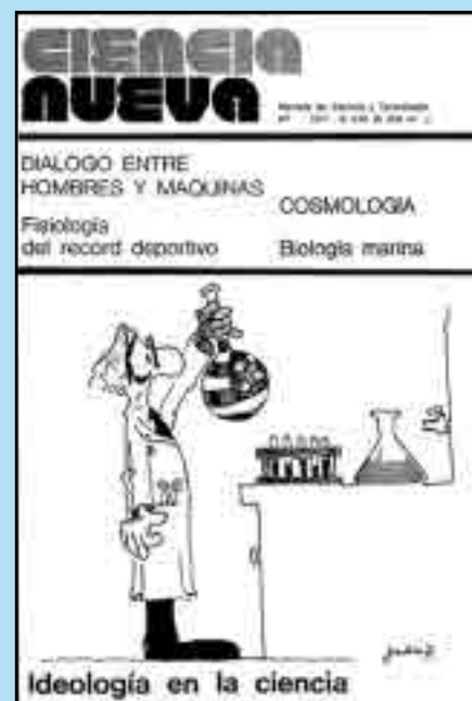
Tapa, Ciencia Nueva número 10