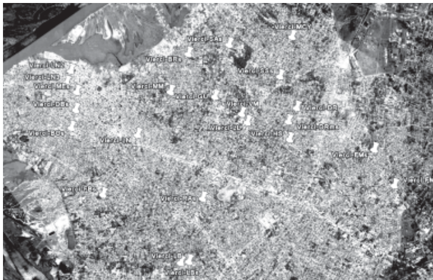
Gráfico 1: Distribución de supermercados del Grupo Vieri en el Gran Asunción

Además de la comercialización de alimentos -principal fuente de ingreso para los supermercados según CAPASU- estas grandes cadenas tienen una variedad cada vez mayor de productos bajo su control, desde lápices hasta televisores y lavarropas. Los patios de comida se han vuelto infaltables en cada establecimiento y permiten, para evitar pérdidas, reciclar los productos que, por uno u otro motivo no se pudieron comercializar en las góndolas. El enorme crecimiento de la economía supermercadista (nada menos que el 52% sólo en 2007) y su funcionamiento en escala, ha tenido como contrapartida el cierre de cientos de negocios, panaderías, comedores, despensas y hasta librerías familiares, cuya mano de obra fue reemplazada por empleos que en la mayoría de los casos se da en condiciones de explotación. Todo esto se ha justificado con premisas del